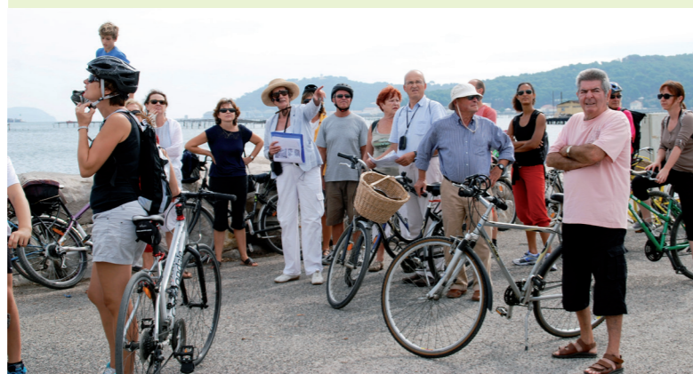
Balade commentée à vélo

Avec la Ligue pour la protection des oiseaux (LPO), venez apprendre comment préserver l'habitat des moineaux, hirondelles, petits mammifères, reptiles et amphibiens grâce à la mise en place de refuges. Venez aussi découvrir la faune qui vit dans nos villes et villages, ainsi que les méthodes pour construire et rénover tout en préservant cette biodiversité de proximité.