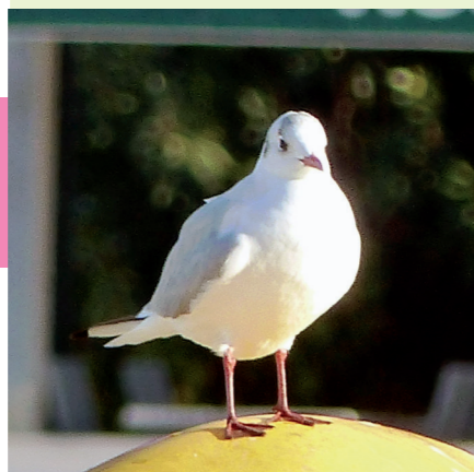
Une mouette rieuse en ville

Expositions « Les refuges de la LPO » et « Biodiversité et patrimoine bâti ».