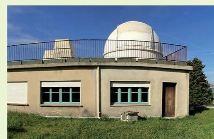
L'observatoire d'astrophysique de La Seyne-sur-Mer