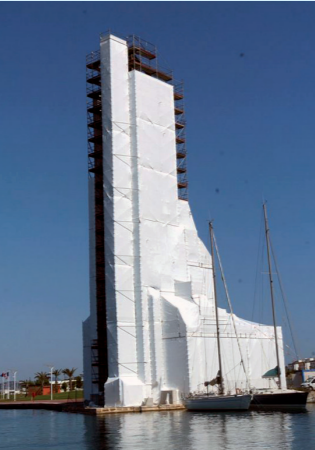
2009 : Le Pont en rénovation