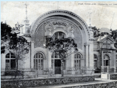
Le casino de Tamaris, début XXe