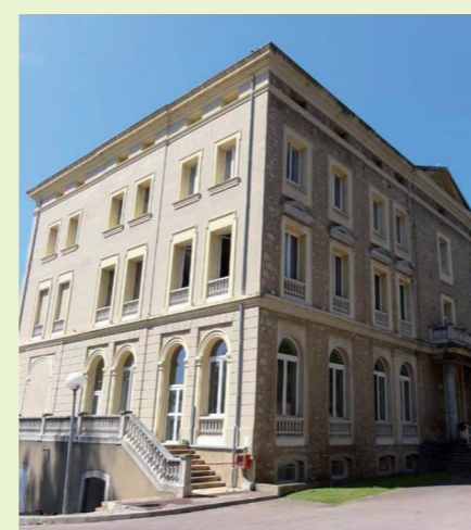
La villa Tamaris centre d'art