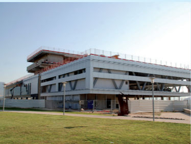
Le casino JOA en construction