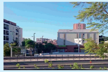
La place Saint-Jean

du 19 septembre au 17 octobre 2015, médiathèque Andrée Chedid, ouverture samedi 10h-18h, mardi 14h-18h, mercredi 10h-13h / 14h-18h, jeudi 10h-13h, vendredi 14h-18h 3