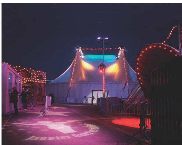
© JP Estournet – Espace Chapiteaux des Sablettes

Le Festival du Cirque Contemporain « Janvier dans les étoiles » est organisé par l'Association Théâtre Europe (Pôle National des Arts du Cirque - Méditerranée), en partenariat avec la Ville de La Seyne-sur-Mer et le Conseil général du Var, avec le soutien de la Direction Régionale des Affaires Culturelles, le Conseil Régional Provence-Alpes-Côte d'Azur, la communauté d'agglomération Toulon Provence Méditerranée et l'Office National de Direction Artistique.