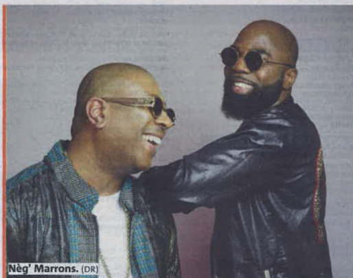
Nèg' Marrons.